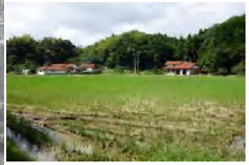
掩体跡に立つ民家